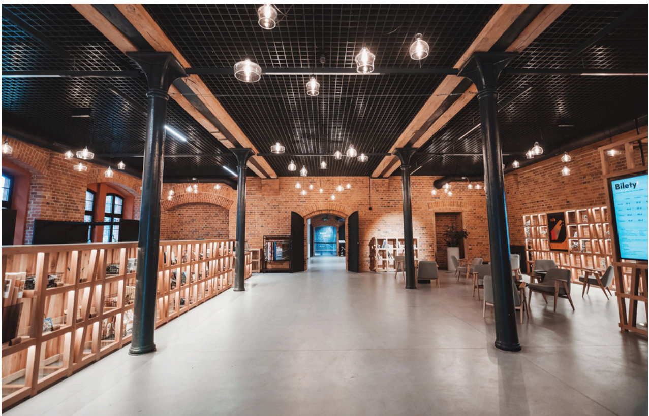
Lada w strefie wejścia

https://mlynYROthera.pl/wystawy-stale/wezly-opowiesc-o-miescie-nad-rzeka/