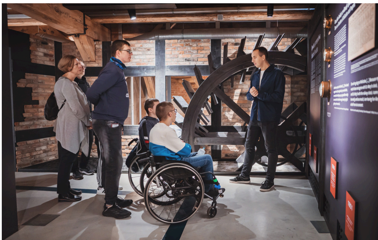
Model koła młyńskiego.