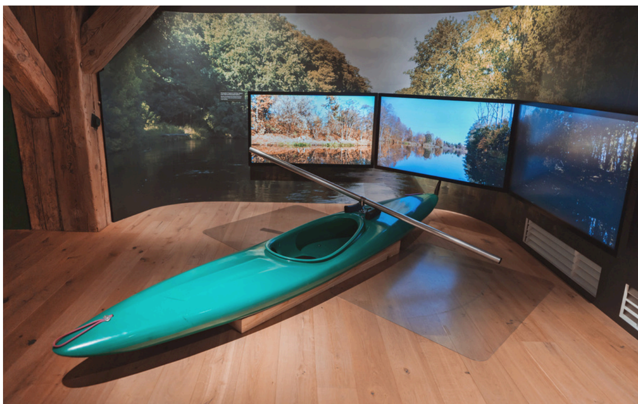
Kajak - możesz pobawić się w pływanie po rzece.