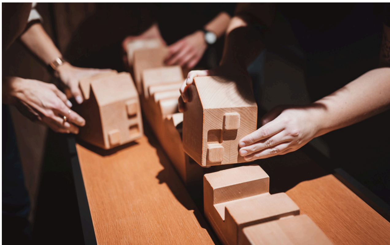
Klocki w kształcie budynków.