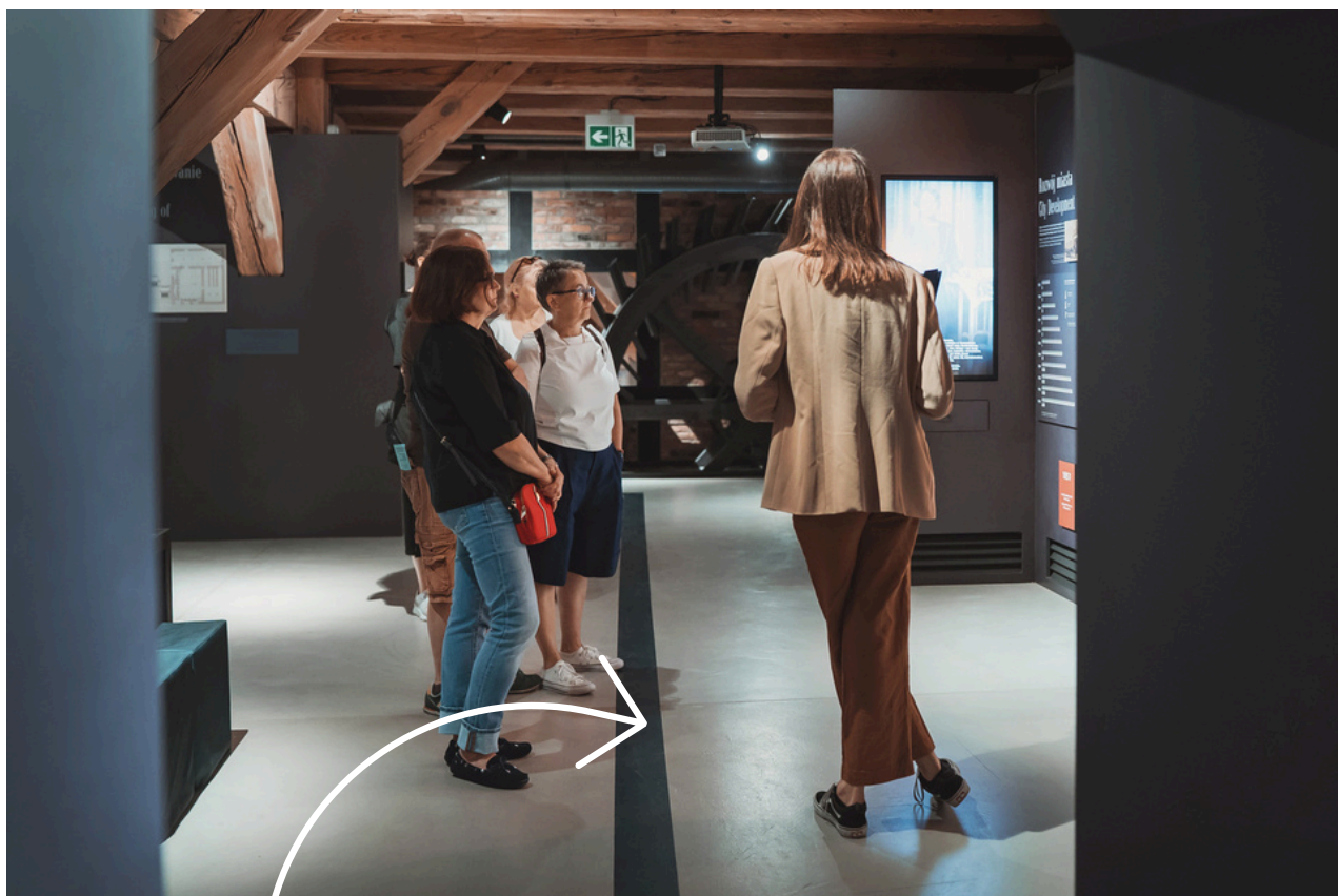
Granatowa linia na podłodze