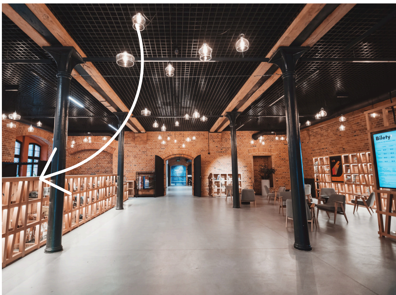
Punkt info, szatnia

Na parterze znajduje się punkt info i szatnia. Tu możesz poprosić o pomoc pracowników Młynów. Są tu też fotele, na których możesz usiąść i odpocząć. W kolejnym pomieszczeniu znajdują się toalety. Poznasz je po zielonych drzwiach.